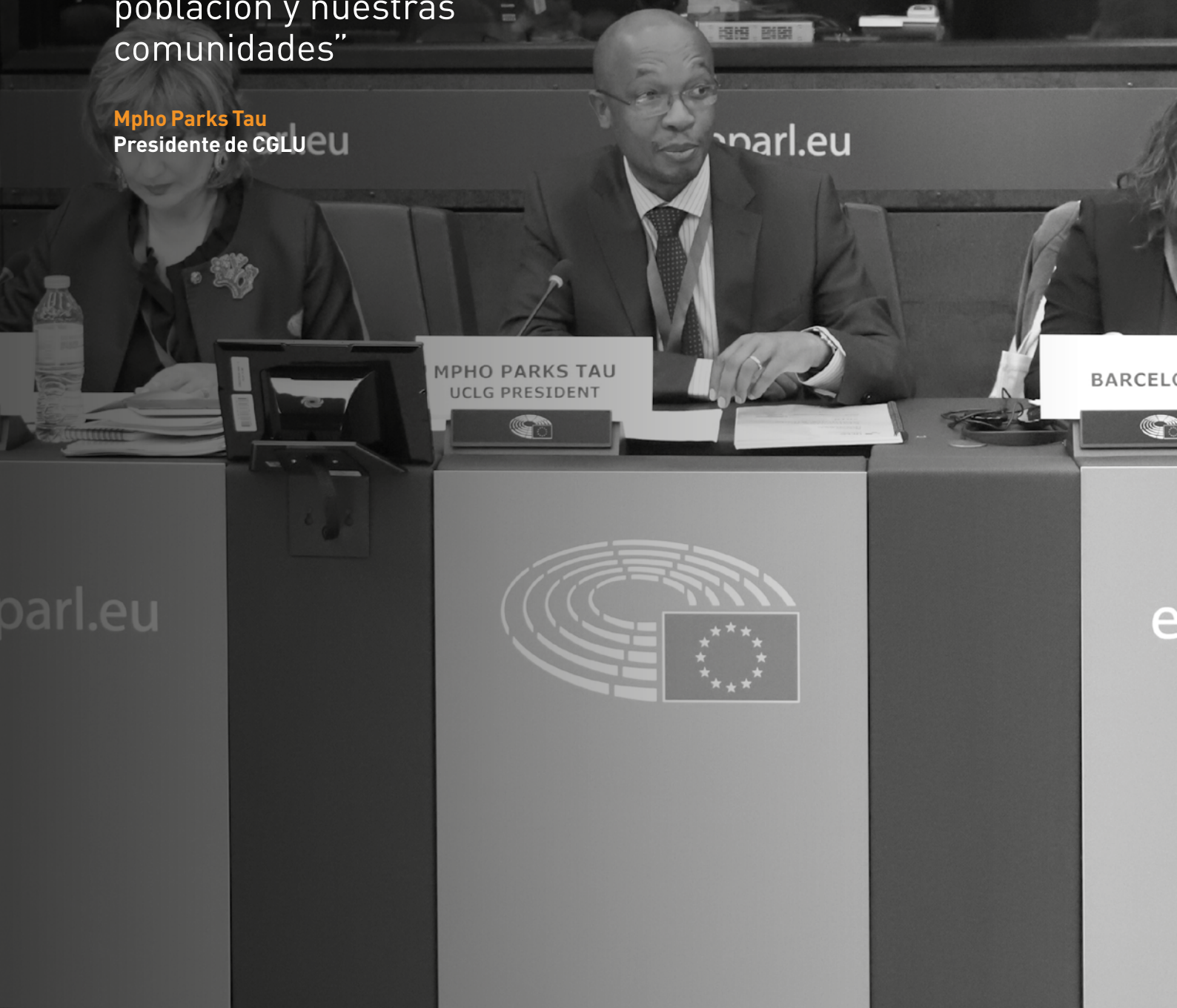
Mpho Parks Tau Presidente de CGLU

“Un diálogo como el de hoy, que acoge a las esferas local, regional y nacional de gobierno, es un avance importante que debemos celebrar. La implicación de los gobiernos locales y regionales en las agendas globales debe incrementar y mejorar, para lograr una mejor vida de nuestra población y nuestras comunidades”