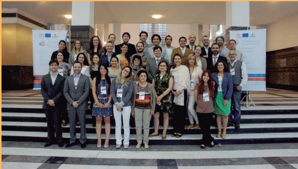
• Proyecto AL-LAs

Las ciudades no son meros espacios que reciben los impactos del exterior, sino que en sus territorios y entre sus ciudadanos se gestan propuestas innovadoras de desarrollo, tendencias y soluciones urbanas que vale la pena compartir y analizar