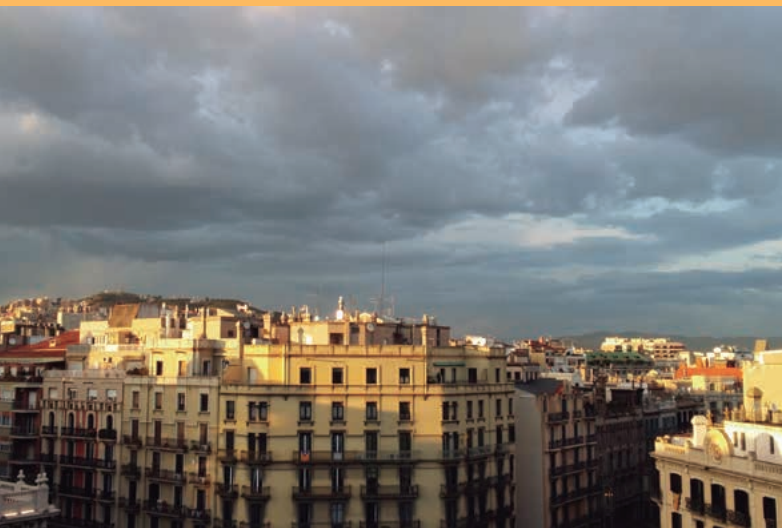
• Barcelona / V.S.