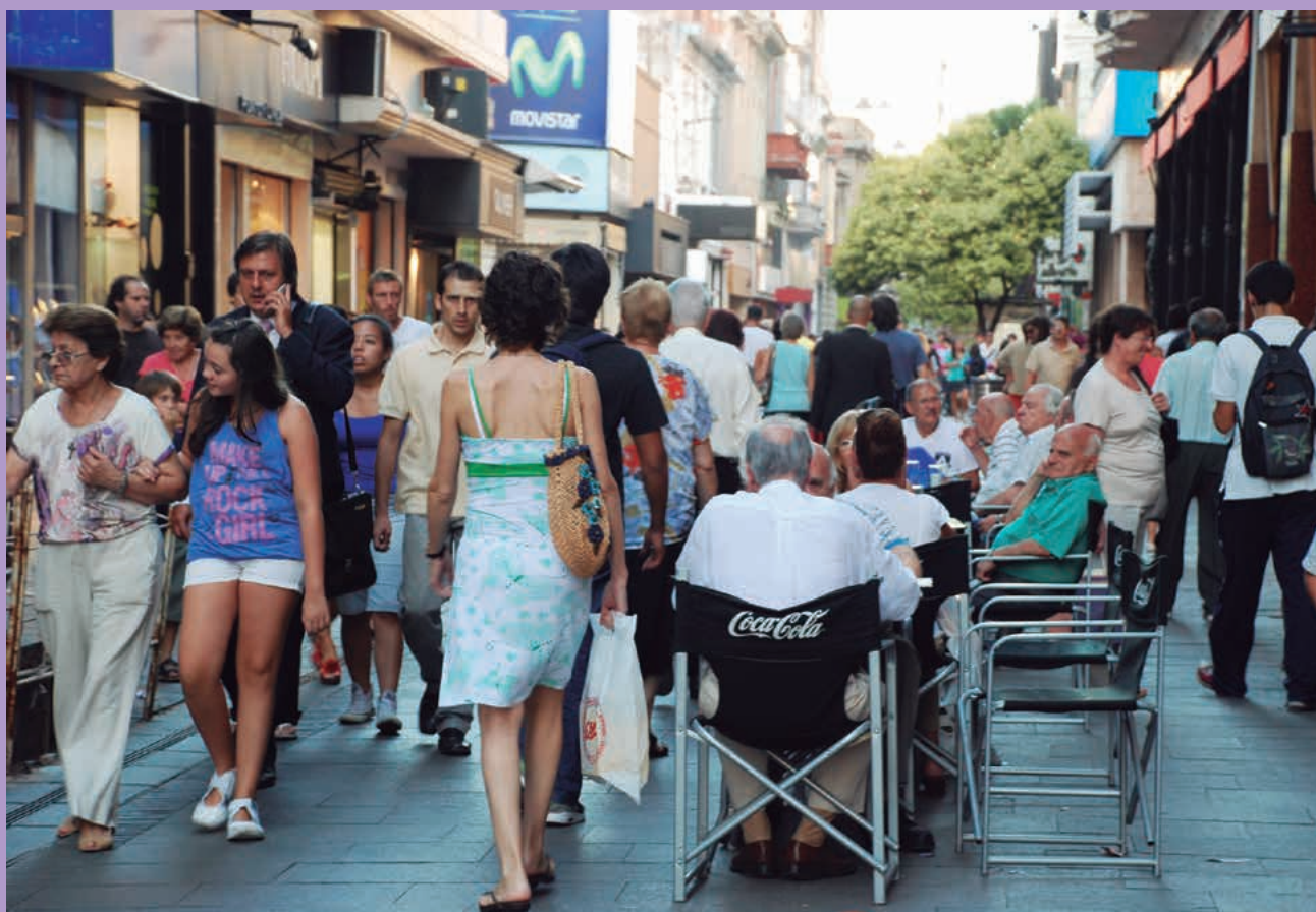
• Rosario, Argentina. V.S.

El nuevo Instrumento de Colaboración para la Cooperación con Terceros Países presenta interesantes oportunidades para las estrategias de proyección exterior y de desarrollo territorial de los actores locales europeos y latinoamericanos