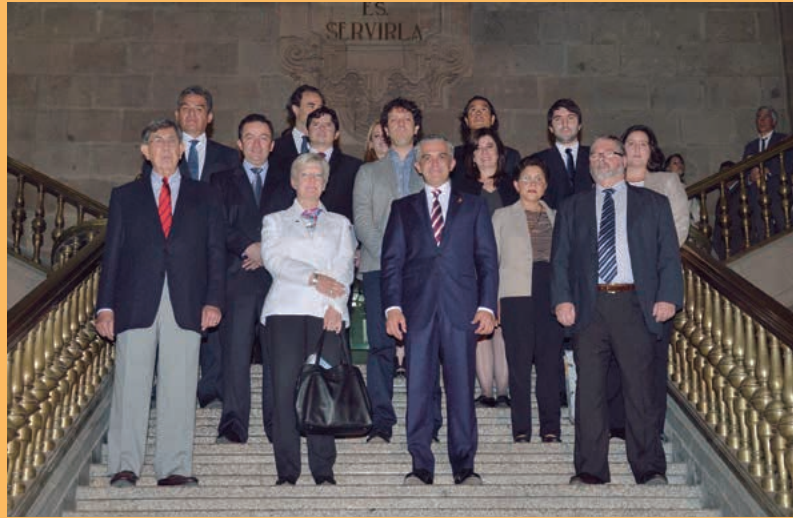
• Proyecto AL-LAs

AL-LAs se consolida así como una red promotora de experiencias e innovación, con ciudades más activas internacionalmente, con el apoyo de nuestros colaboradores: la Asociación Mexicana de Oficinas de Asuntos Internacionales de los Estados (AMAIE), la Asociación de Responsables de Relaciones Internacionales de los Gobiernos Locales de Francia (ARRICOD), el Instituto Francés de América Latina (IFAL, Embajada de Francia en México) y la Universidad del Rosario en Colombia. A AL-LAs se suman una serie de