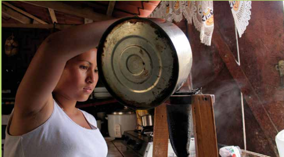
• Alba Sud - Investigación y Comunicación para el Desarrollo

2012 de la Oficina de Cooperación al Desarrollo de la Diputación de Barcelona y bajo el impulso de la entidad Alba Sud, se creó un partenariado integrado por el Ayuntamiento de Sant Cugat (Barcelona), el Ayuntamiento de Tamanique (El Salvador), la Escuela Universitaria de Hostelería y Turismo (CETT, UB, Barcelona) y las agencias catalanas Exode Viajes y Tosca Servicios Ambientales, de Educación y Turismo.