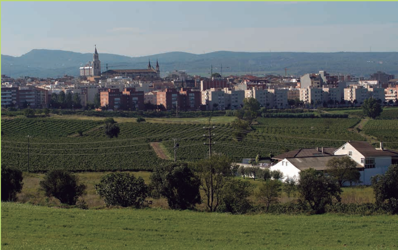
• Vilafranca del Penedès

Técnica de la Dirección de Relaciones Internacionales de la Diputación de Barcelona