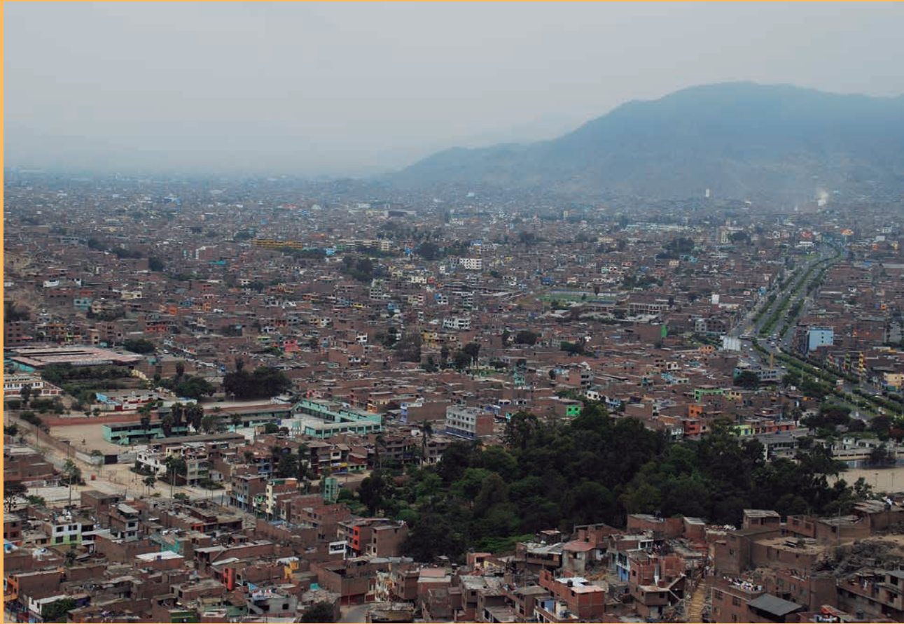
• Panorámica del área metropolitana de Lima

hecho, a raíz de su participación en URB-AL III muchos gobiernos subnacionales socios han emprendido nuevas relaciones de cooperación. Un ejemplo sería el caso de Montevideo, Santa Fe y Pernambuco, que han puesto en marcha una iniciativa de cooperación Sur-Sur.