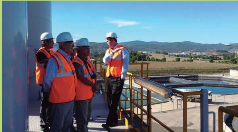
• Fundación ENT

Entre las recomendaciones formuladas a Bogotá para revertir esta situación destaca el desarrollo de un modelo integral de gestión de residuos que contemple todos los aspectos y actores involucrados en el proceso y el desarrollo de un marco legal sólido. Asimismo, se propone la adaptación de medidas para la reducción de los escombros generados; la creación de un re-