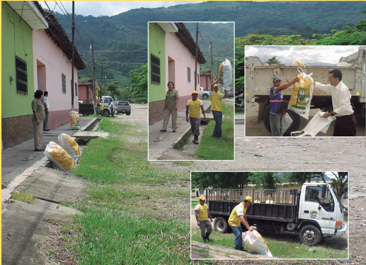
• Política “Ciudad Limpia” de la Mancomunidad Trinacional Fronteriza Río Lempa.

Experta en RRII. Dirección de Relaciones Internacionales de la Diputación de Barcelona