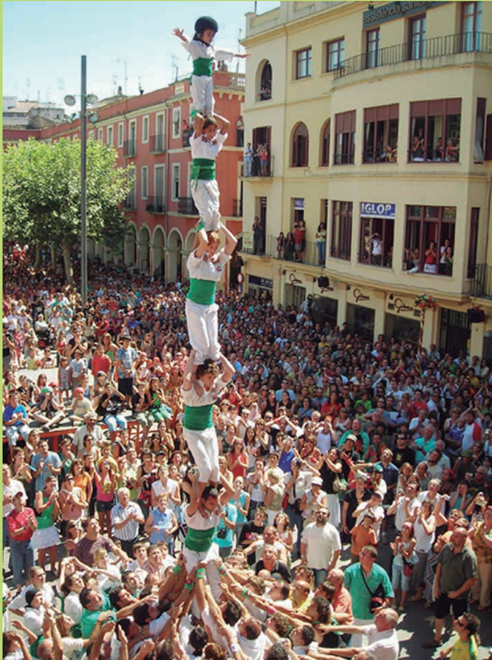
• Castellers de Vilafranca del Penedès

En definitiva, el proceso de elaboración de este plan ha generado una dinámica de trabajo intensa y valiosa entre los distintos servicios del Ayuntamiento. Sin embargo, es preciso subrayar que el plan representa sólo un punto de partida a partir del cual se abre un proceso de definición del rol y de las modalidades de participación de los distintos actores locales en la estrategia internacional del municipio. La capa-