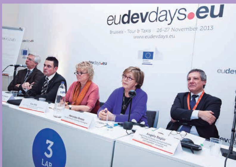
• EDD 2013, Bruselas

Asimismo, se puso sobre la mesa, a partir de ejemplos prácticos como el Programa URB-AL III, la eficacia de un nuevo modelo de cooperación descentralizada que huya de relaciones asistencialistas y verticales y se centre en un enfoque horizontal a partir de partenariados entre iguales. Un modelo sostenible que ponga en valor a todos los actores del territorio, públicos y privados, para la mejora de la calidad de vida de los ciudadanos.