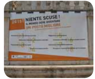
Campaña de las Ciudades del Milenio de CGLU París – Buenos Aires – Roma