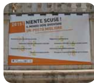
Campagne pour les OMD : Paris - Buenos Aires - Rome